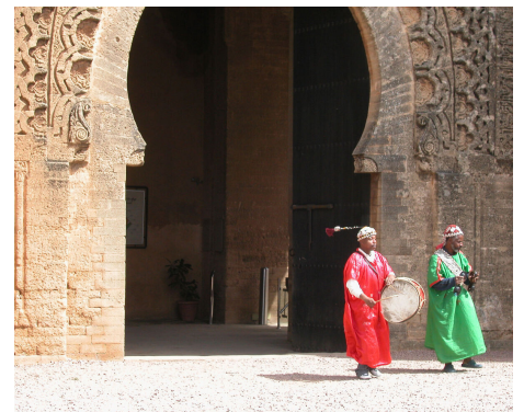
Königsstadt des Landes.